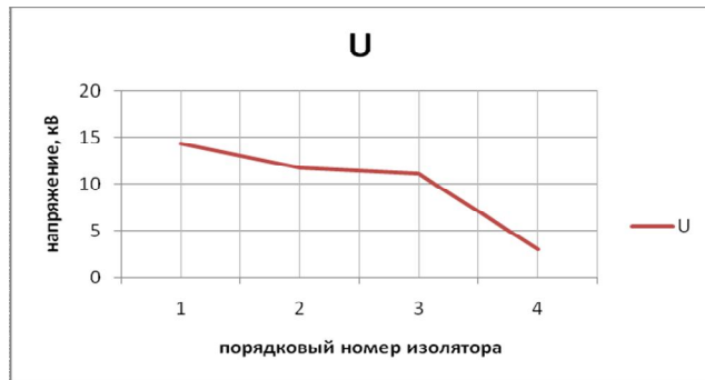
Рис. 3 – Зависимость напряжения U от порядкового номера изолятора в гирлянде

График зависимости напряжения U от порядкового номера изолятора в гирлянде показан на рис.3.