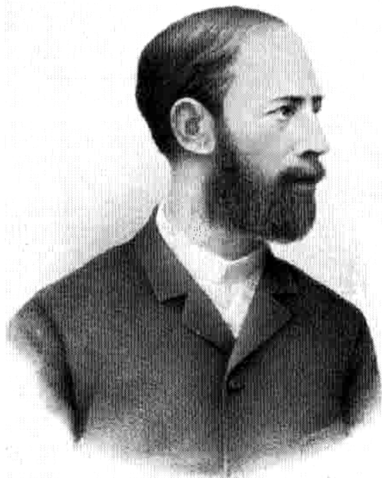
Генрих Рудольф Герц (1857–1894)

трусит жизнью рисковать, тому успеха в ней не знать!" [1, 3]. Здесь он попадает в прекрасные "руки" – его научным руководителем становится видный немецкий физик Герман Людвиг Гельмгольц [4], автор и до сих пор с успехом используемой в физике, технике сильных магнитных и электрических полей и электротехнике магнитной системы с однородным полем, получившей название "кольцо Гельмгольца" [5].