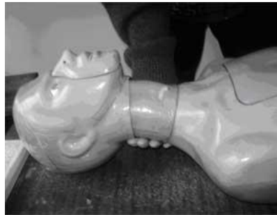
Рисунок 2 – Положення голови тренажера при проведенні штучної вентиляції легень по методу «з рота в рот».

Ліворуч – до, праворуч – після закидання голови.