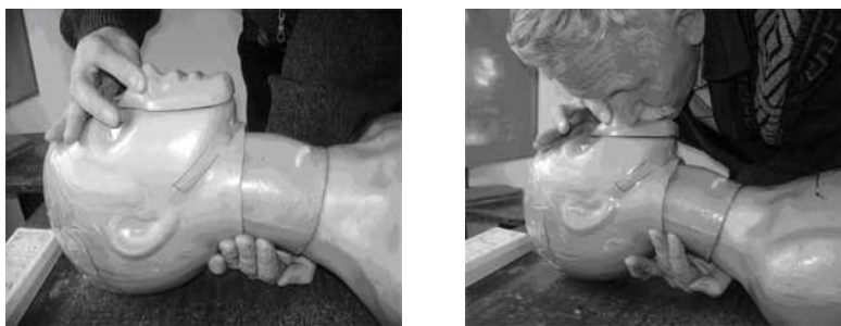
Рисунок 3 – Штучна вентиляція легень «з рота в рот».

Ефективність штучної вентиляції легень проявляється появою рухів грудної клітки, дихальних шумів над легенями і трахеєю, зменшенням синюшності, появою рожевого кольору шкіри по периферії в дорослих, а в грудних дітей – появою пульсу на плечовій артерії. Контроль за надходженням повітря із легенів потерпілого здійснюється по розширенні грудної клітини при кожному вдування.