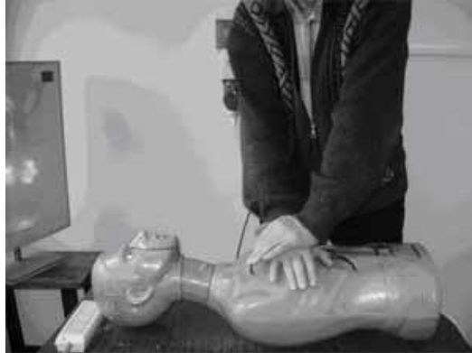
Рис. 4. Непрямий масаж серця.