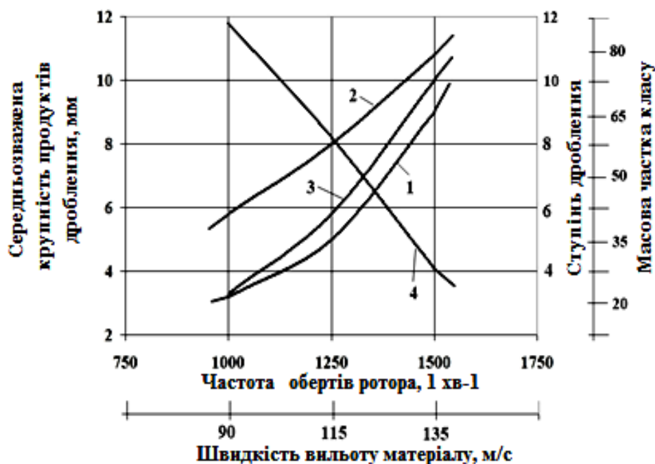
Рис. 2 – Залежність приросту масової частки новоутворених класів мінус 5 мм (1) і мінус 10 мм (2), ступеня дроблення (3) і середньозваженої крупності продуктів дроблення (4) від частоти обертання ротора і швидкості вильоту матеріалу

Встановлено залежність технологічних показників дробарки від швидкісного режиму її роботи (рис. 2).