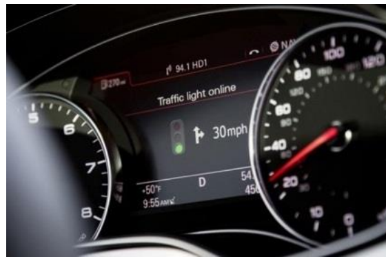
Рисунок 2 - Підказка водієві про бажаний режим руху

Результати дослідження представлені в таблиці 1. З таблиці 1 можна побачити, що 79.4% всього загражданення потоку перехрестя створюють легкові автомобілі і 13.3% всього потоку перехрестя складають маршрутні автобуси.