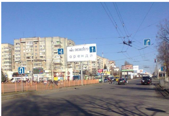
Рисунок 1 - Перехрестя м. Луцька, проспект молоді і соборності

Для прикладу можна взяти типове перехрестя м. Луцька (рис. 1). На ньому магістрантами Луцького НТУ було проведено дослідження руху транспортних засобів.