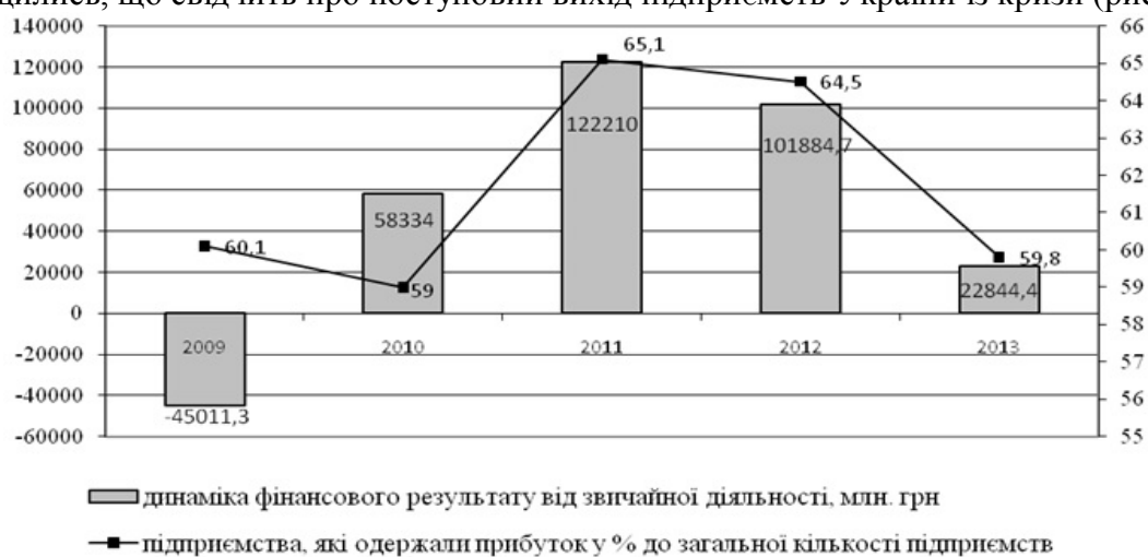
Рис.1. Динаміка фінансового результату від звичайної діяльності в 2009-2013 рр.

У 2010 році фінансові результати від діяльності підприємств значно покращились, що свідчить про поступовий вихід підприємств України із кризи (рис. 1).