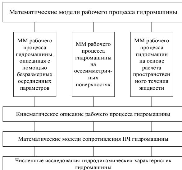
Рис. 1 – Блок-схема математического описания рабочего процесса гидромашин

В настоящее время проводится работа по систематизации данных коэффициентов потерь энергии в элементах проточной части, полученных на основании расчетных и экспериментальных исследований обратимых радиально-осевых гидромашин.