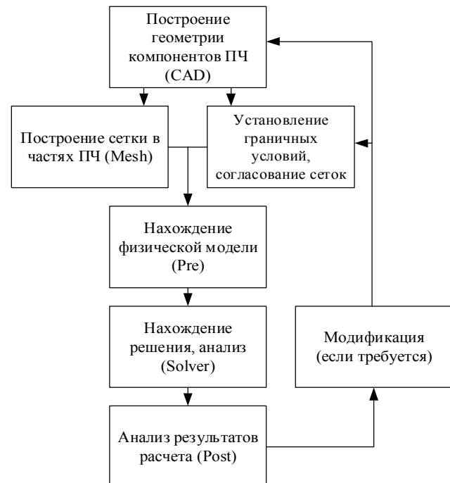
Рис. 2 – Алгоритм расчета пространственного течения жидкости с помощью специальной программы

метод с разными типами сеток. Геометрию расчетной области можно создавать в одной из программ (SolidWorks, CATIA, ProEngineer и др.) и импортировать в программу. Комплекс расчетной программы имеет удобный интерфейс, позволяющий выполнить автоматическую генерацию расчетной сетки, выбрать математическую модель течения и задать граничные условия. Алгоритм проведения расчета по программе приведен на рис. 2.