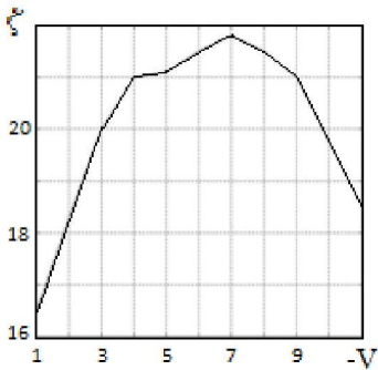
Рис. 2 – Зависимость коэффициента обратного сопротивления диода от скорости воды.

определенной точке ударного трубопровода. Для моделирования динамических процессов в трубопроводах, которые сопровождаются гидравлическими ударами, как правило, используются уравнения, представленные, например, в [5], решение которых определяется на прямоугольной сетке характеристик. Набор соответствующих модулей в среде пакета MatLab рассмотрен в работе [6]. Для их использования при решении поставленной в настоящей работе задачи необходимо рассмотреть описание состояния потока жидкости в точке установки крупномасштабного струйного диода.