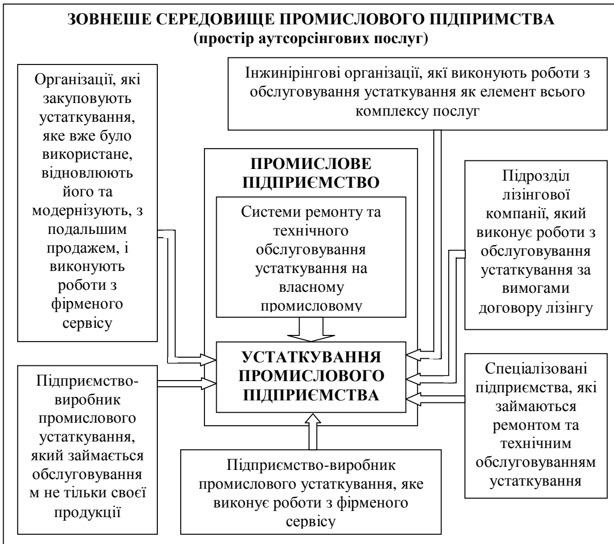
Рис.1 – Організаційні форми ремонтного та технічного обслуговування устаткування промислових підприємств

3. Закупівля обладнання, яке вже було у використанні, здійснення його капітального ремонту з подальшою модернізацією і післяпродажним обслуговуванням. Великий інтерес являє собою досвід Німеччини, де різноманітні види послуг технічного характеру стали достатньо прибутковим і надійним бізнесом. Більше 300 торговельних фірм Німеччини були зацікавлені в закупівлі устаткування, яке вже використовувалось, щоб після капітального ремонту і відновлення експлуатаційної надійності повернути його у виробництво. Капітальний ремонт верстатів відбувається з урахуванням новітніх технологічних досягнень. У більшості випадків після доопрацювання верстат ні в чому не поступається останнім моделям. В ході ремонту машини оснащуються блоками ЧПУ і навіть системами комп'ютерного управління. Ціна відновленого та модернізованого обладнання менше від ціни подібного нового, приблизно, на третину.