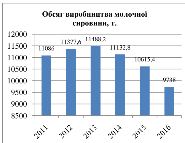
Рисунок 2 – Динаміка обсягів виробництва молочної сировини за 2011-2016 рр.

На протязі останніх 5 років спостерігається постійне зниження обсягів виробництва молочної сировини. Так у 2015 році вироблено 10615,4 т молока в обсязі 95,4% від рівня 2014 року, а за січень-листопад 2016 року - 9738,0 т молока в обсязі 97,7% до відповідного періоду 2015 року [1]. На рисунку 2 наведено динаміку обсягів виробництва молочної сировини за 2011-2016 рр.