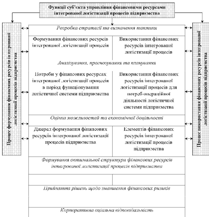
Рисунок 1. – Функції суб'єкта управління фінансовими ресурсами інтегрованої логістичної процесів підприємства

Фінансова стратегія інтегрованої логістичної процесів на підприємствах забезпечує: