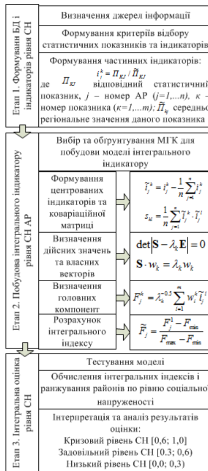
Рисунок 1 – Методичний підхід до побудови інтегрального індексу рівня соціальної напруженості (СН) адміністративних районів

житлово-комунальних послуг до середньорічної чисельності населення. Частинні індикатори розраховані на основі статистичних даних [8].