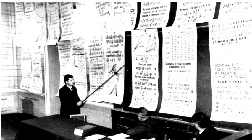
Защита докторской диссертации в Ученом совете ХПИ