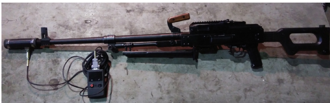
Рис. 2. Установка модуля регистрации ХЦ-7 на ствол стрелкового оружия

Модуль регистрации устанавливается на ствол стрелкового оружия вместо пламегасителя посредством резьбового соединения (рис 2).