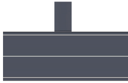
Рисунок 1 – Схема ударного нагружения двухслойной пластины с покрытиями

стины определялось при значениях начальной скорости удара пробойника - 10м/с и 100м/с.