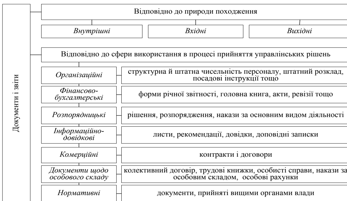
Рис. 3. Класифікація документів і звітів готелів та ресторанів

Структурування даних звітності дає змогу будувати підґрунтя для розробки пропозицій у напрямі вдосконалення чинного законодавства, методичних рекомендацій з різних підходів до контролю, механізмів виявлення та фіксації порушень, що має велике значення для підвищення ділової кваліфікації працівників, якості та точності контрольних дій.