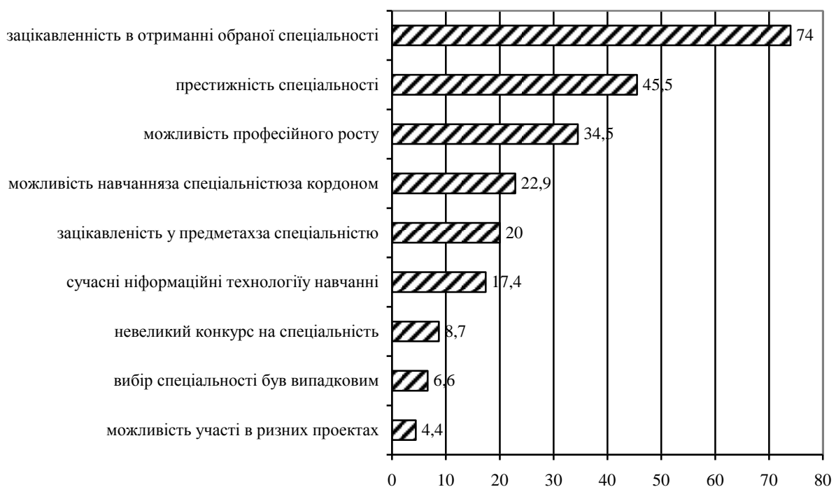
Рисунок 2 – Розподіл відповідей на питання «Що впливало на Ваш вибір спеціальності?» (у %)

ників, що визначили своє зацікавлення у вивченні соціально-гуманітарних дисциплін. Тим більше, що у порівнянні з минулими роками показники рейтингів для цієї позиції в опитуванні були значно менші. Так у 2014-2015 роках ця позиція мала 4-й ранг, а у 2016 році – він був 6-м. Стабільно, перше місце віддається знанням саме зі своєї спеціальності, а знанням необхідним для створення власного бізнесу протягом 2014-2016 років віддавалося друге місце. Базові знання з усіх дисциплін протягом 2014-2016 років мали третє місце та тільки у 2017 році знизили показник до четвертого рангу. Стабільність демонструють показники рейтингів відповідей про прагнення до занять наукою – 7 місце протягом 2014-2017 років та восьме рангове місце для відповіді про прагнення займатися наукою (за цей же період).