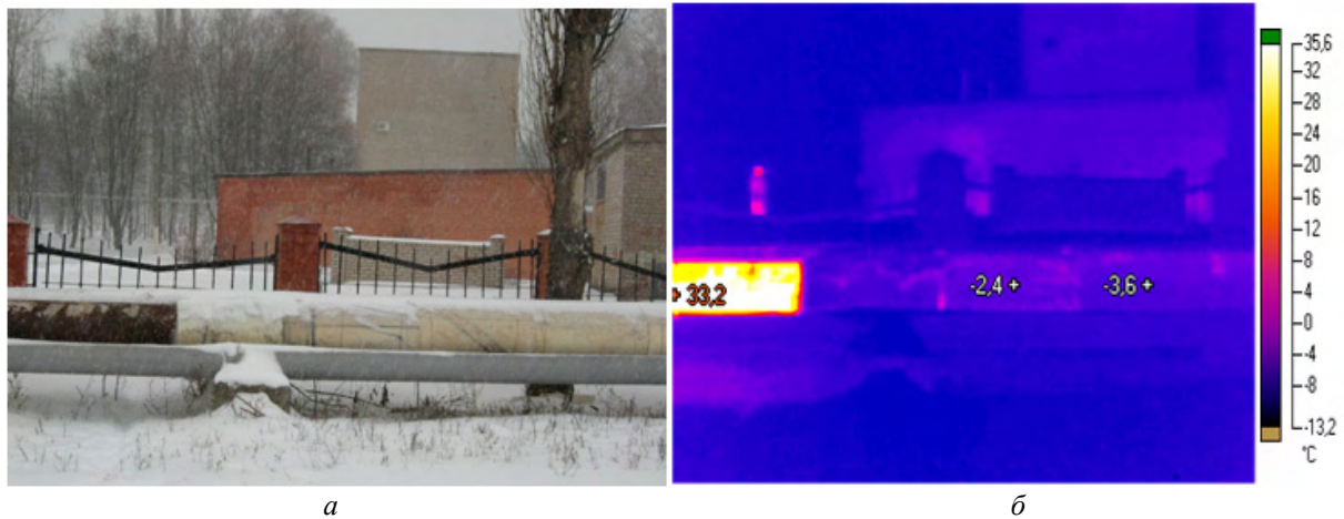
Рис. 1 – Ділянка трубопроводу з пошкодженою теплоізоляцією (а) та її термограма (б)