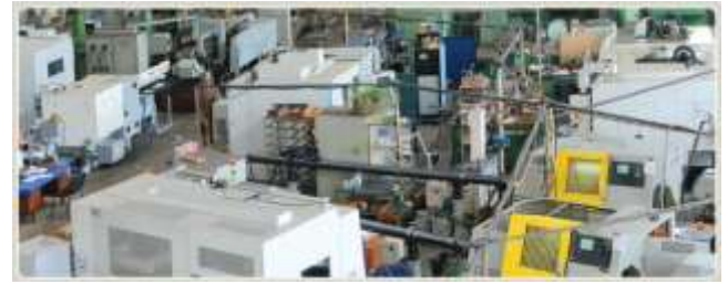
Рис. 2 – Производственный участок, оснащенный современными высокоточными металлообрабатывающими центрами и станками с ЧПУ

Результаты исследований, приведенные в настоящей работе, используются в практической деятельности при изготовлении формующей оснастки для макаронной и кондитерской отраслей промышленности в ОАО «Империя металлов» (г. Харьков). Производство оснащено современными высокоточными металлообрабатывающими центрами и станками с ЧПУ (рис. 2). На рис. 3 – рис. 4 приведены некоторые образцы изготавливаемой оснастки, на рис. 5 – рис. 7 – сложнопрофильные изделия различного назначения.