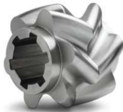
Рис. 6 – Шестерня шевронного насоса из нержавеющей стали 12Х18Н10Т