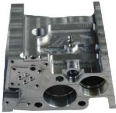
Рис. 7 – Корпус распределителя карбюратора