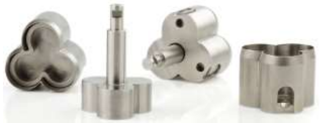
Рис. 4 – Оснастка для производства пряников