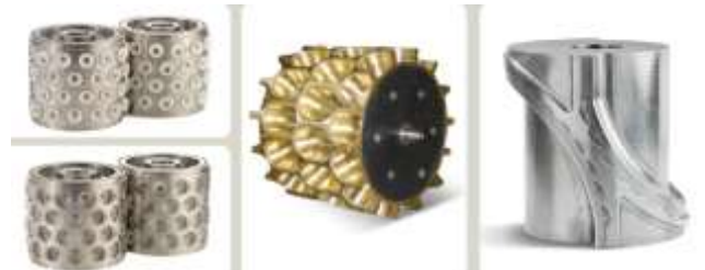
Рис. 5 – Валы для производства пельменей и вареников