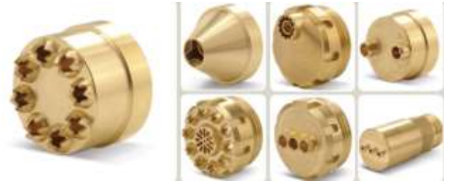
Рис. 3 – Фильтры для производства отсадного печенья