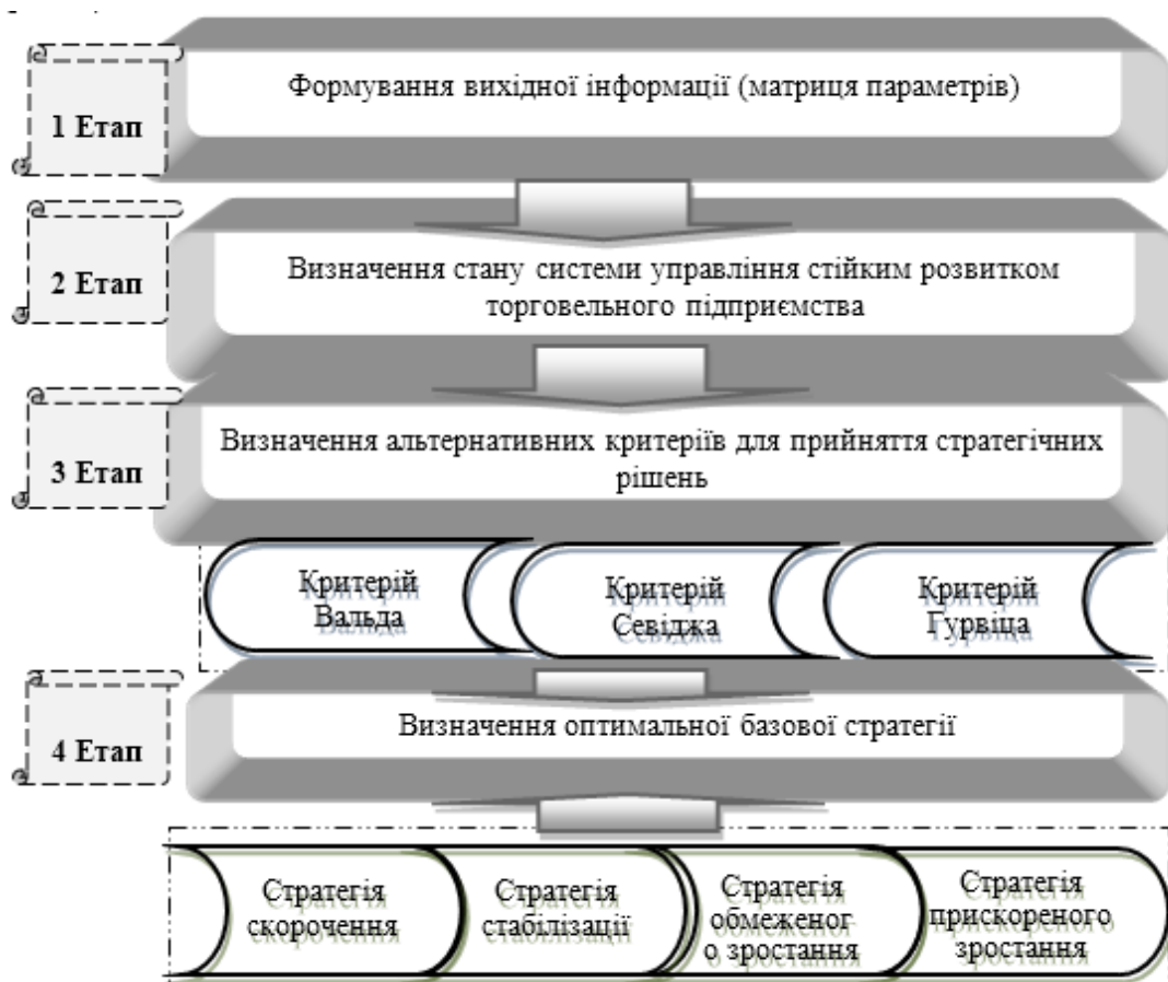
Рис. 2 – Алгоритм визначення оптимальної базової стратегії управління стійким розвитком підприємств

Запропонований алгоритм обґрунтування вибору стратегій системи управління стійким розвитком підприємств наведений на ( див. рис. 2).