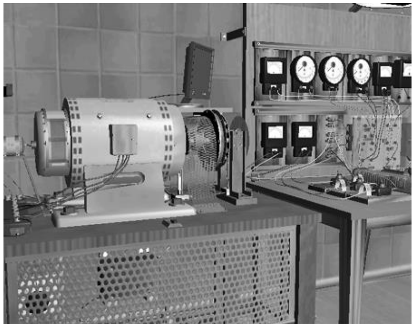
Рис.2. Приладова панель та стіл віртуальної лабораторії для дослідження ДПС

Графічна модель віртуального стенду для дослідження асинхронного двигуна (АД) подана на рис. 3.