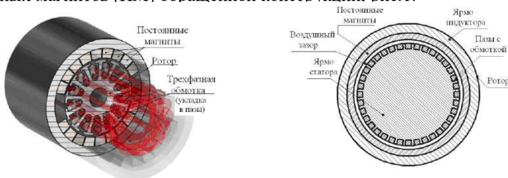
Рис. 1. Общий вид и схема многополюсного СГ обратной конструкции с возбуждением от постоянных магнитов

В работе показана необходимость использования энергии от возобновляемых источников (ВИЭ), в частности, энергии ветра. Определены особенности использования ВИЭ для индивидуальных энергопотребителей малой мощности, выполнен обзор возможных типов генераторов для индивидуальных ветроэнергетических установок (ВЭУ). Предложено комплектовать ВЭУ мощностью 5-10 кВт синхронным генератором (СГ) с возбуждением от постоянных магнитов (ПМ) обратной конструкции. рис.1.