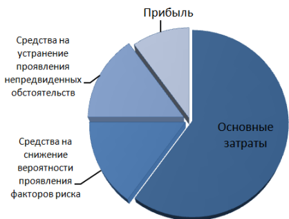
Рис. 1 – Структура бюджета проекта

особенно его части на «непредвиденные обстоятельства», зачастую базируется на опыте и интуиции, поэтому очень слабо формализовано, не подкреплено никакими расчетами и прогнозами. Следовательно, по мере возрастания сложности проектов менеджеры сталкиваются с большей проблемой управления в этих условиях. В связи с этим авторами предлагается применение инструментов системной динамики для более эффективного управления рисками и «непредвиденными обстоятельствами» на протяжении всего жизненного цикла проекта. На рис. 1 представлено схематическое отображение структуры бюджета проекта с учетом «непредвиденных обстоятельств».