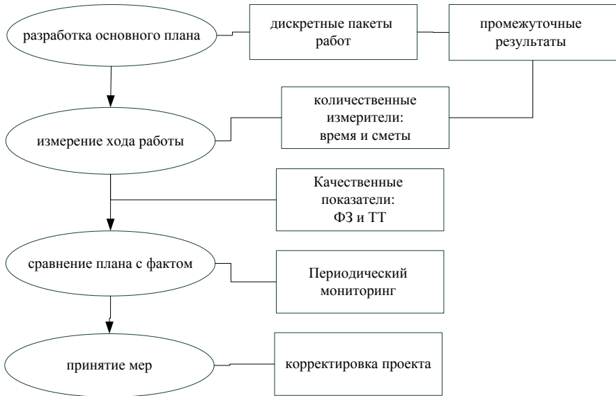
Рис. 1 – Основные этапы контроля хода выполнения проектных работ и соответствующие результаты

Измерение и оценка хода выполнения проекта делают необходимым процесс контроля, состоящий из четырех этапов (см. рис.1).