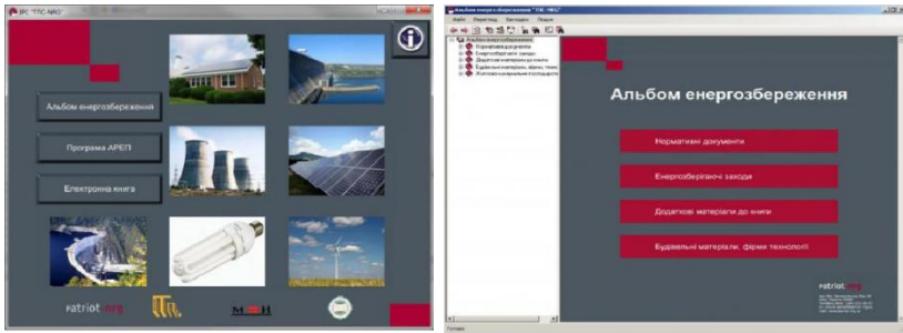
Рис. 3 – Програма АРЕП

Результати досліджень. Проаналізував і систематизував структуру інформаційних технологій до енергоощадних проєктів пропонуємо блок схему управління енергоощадними проєктами з застосуванням ГІС технологій, АСУ, ІМБ та інших управляючих та візуальних систем (Рис.4).