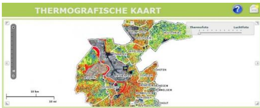
Рис. 1 – Термографічна карта дахів Бельгії

Матеріали досліджень. Інформаційні технології (ІТ) покликані, раціонально використовуючи сучасні досягнення в галузі комп'ютерної техніки та інших високих технологій, новітніх засобів комунікації, програмного забезпечення і практичного досвіду, вирішувати завдання щодо ефективної організації інформаційного процесу для зниження витрат часу, праці, енергії і матеріальних ресурсів у всіх сферах людського життя і сучасного суспільства, у тому числі і у енергоощадних проектах [8]. Енергоощадні проекти припускають традиційний підхід та каскадний метод управління, тобто, на етапі ініціювання проводиться енергоаудит, де нам можуть допомогти ГІС технології: термографічні карти, термографічна зйомка з накладенням на об'єкти. Наприклад, міські адміністрації Бельгії намагаються зацікавити населення у вирішенні проблеми втрат тепла шляхом підтримання заходів з ізоляції дахів через податкові знижки та інші матеріальні стимули. Он-лайн проект "Збільш свій дах" [9] намагається допомогти вирішити це питання через відносно просту візуалізацію - теплову карту. В результаті, вийшла найбільша термографічна карта, доступна в даний час он-лайн (Рис.1).