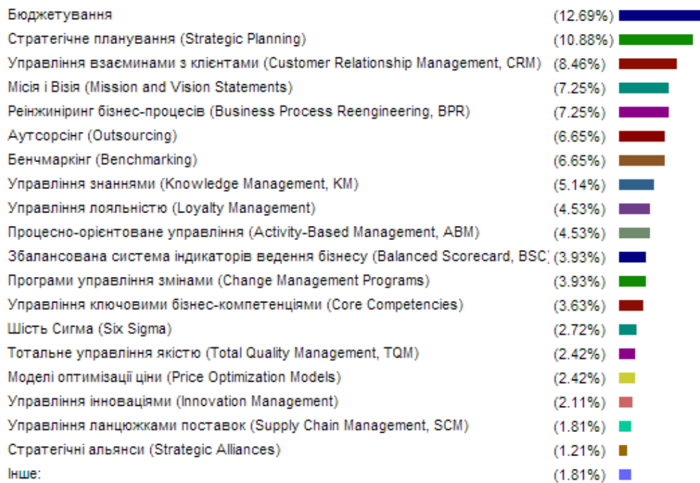
Рис. 2 – Найбільш використовувані управлінські інструменти в українських організаціях

Порівнюючи провідні управлінські показники протягом певного періоду часу можна зробити наступні висновки: