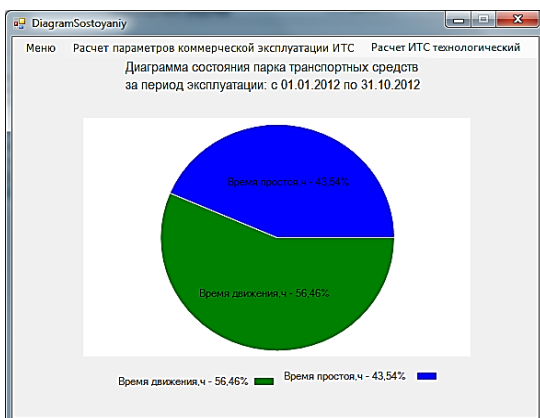
Рисунок 2 – Діаграма стану парку ТЗ за певний період експлуатації

На основі отриманих параметрів будується діаграма стану парку ТЗ за певний період експлуатації (рис. 2).