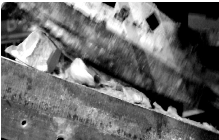
Рис. 2 – Взаимодействие материала со щекой

При достижении потоком материала зоны дробления, куски максимальных размеров (согласно гранулометрической характеристике, предъявляемой к исходному материалу) начинают взаимодействовать с рабочей поверхностью подвижной щеки (рис. 2).