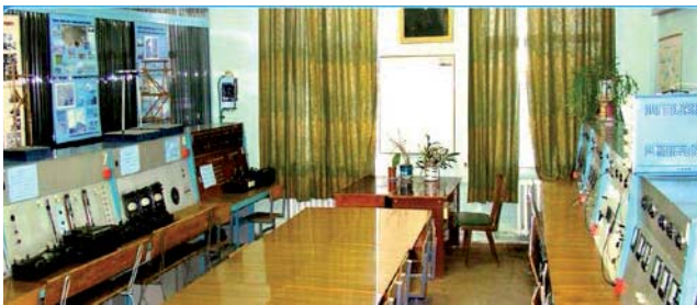
Фото 8 – Лабораторія електричних систем і мереж

В даний період на кафедрі навчається понад 100 студентів усіх рівнів і форм навчання за спеціалізацією «Електричні системи і мережі». У 2020 р. кафедра відкрила прийом студентів на спеціалізацію «Цифрова енергетика». В процесі навчання на цій спеціалізації наші студенти здобудуть знання не тільки в галузі енергетики, а й галузі інформаційних технологій, що суттєво підвищить рівень їх конкурентоздатності на сучасному ринку праці. На кафедрі ведеться викладання англійською мовою для студентів з іноземних країн.