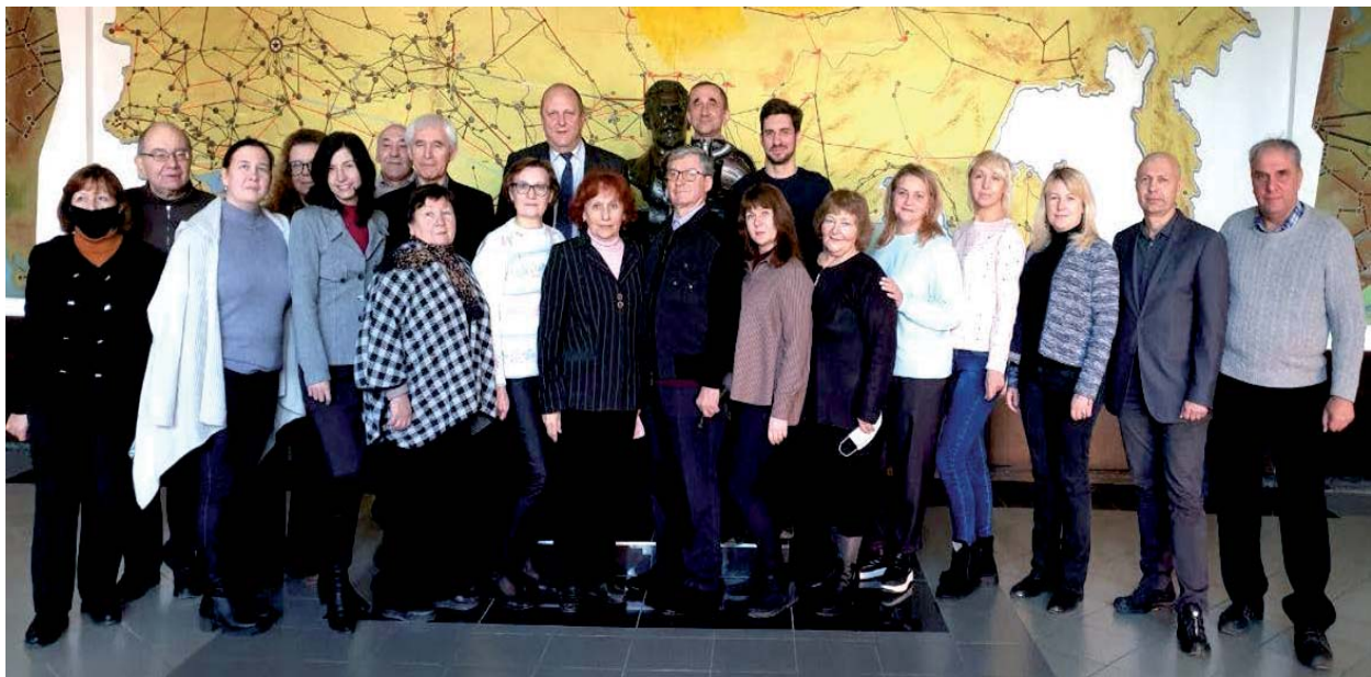
Фото 6 – Колектив кафедри «Передача електричної енергії» (22.12.2020 р.) (зліва направо)