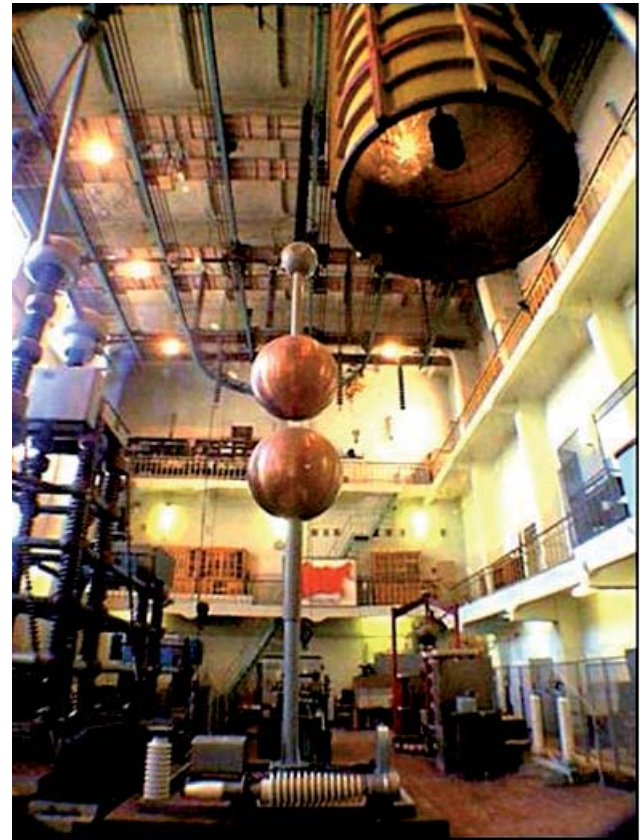
Фото 7 – Високовольтна зала

лабораторні та науково-дослідні роботи, а також курсове проектування з різних дисциплін – електричних систем і мереж, техніки високих напруг, систем автоматизованого проектування підстанцій і ліній електропередач та інших.