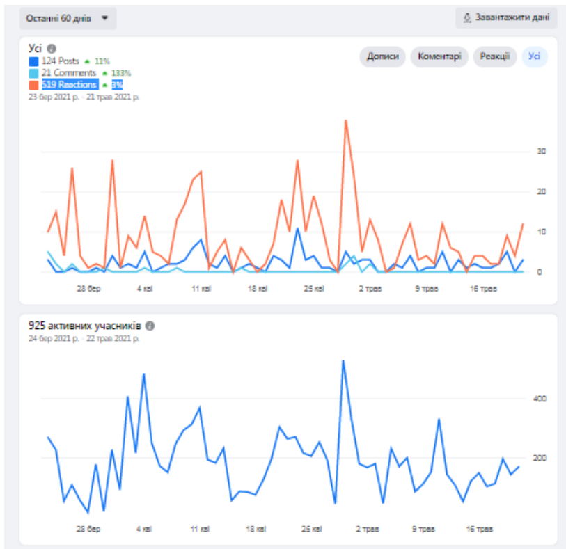
Рис. 1. Завантажені дані (дописи, коментарі, реакції) та активні учасники блогу «Освіта за спеціальністю «Нафтогазова інженерія та технології» за період 23 березня 2021 р. – 21 травня 2021 р.

Найбільш популярний день відвідин сайту – п'ятниця. Популярна година – 10.00 (рис. 2).