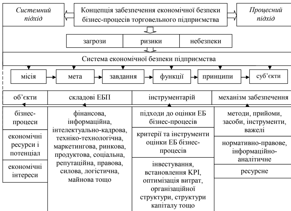
Рис. 2. Концепція забезпечення економічної безпеки бізнес-процесів торговельного підприємства

Погоджуємося з думкою дослідника [12, с. 75] про те, що використання одного з наявних наукових підхо-