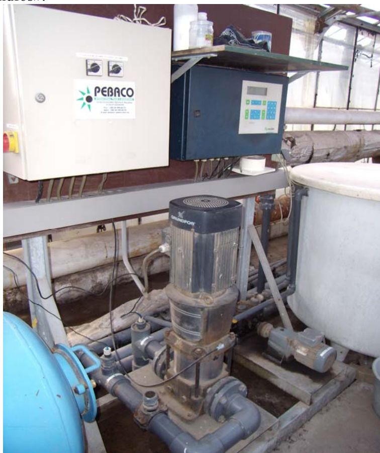
Система дозування розчину для поливу овочів

Для вирощування овочів на закритому ґрунті використовується система крапельного поливу, яка складається з труб ПВХ, клапанів з фільтрами. Комп'ютер здійснює управління показниками поливу (час, кількість, розчину, концентрація розчину, лужність середи). В результаті досягається економія холодної води та витрати електроенергії на її видобування на артсвердловині. Система дозування мінеральних добрив «Нетафлекс» оснащена насосним обладнанням «Grundfos».