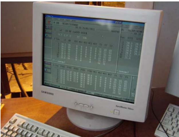
Відображення параметрів системи клімат- контроль

Нетафім», який на протязі 24 годин на добу для обслуговуючого персоналу відображає на моніторі комп'ютера наступні параметри: температура повітря, вологість, рівень сонячної радіації та ін.