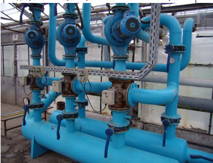
Насоси та клапани регулювання температури теплоносія

Сигнал з контролеру «Нетагроу-Нетафім» надходить до регулюючих клапанів «Honeywell CENTRA VMM 40-24», які підтримують необхідну температуру у контурах опалення теплиць з точністю \pm 1^{\circ}\text{C} шляхом зміни витрат теплоносія та підмішування зворотної води. Станція регулювання температури оснащена насосним обладнанням «Johnson Pump B.V.» CL100-160 ( P = 2,2 \text{ кВт} ).