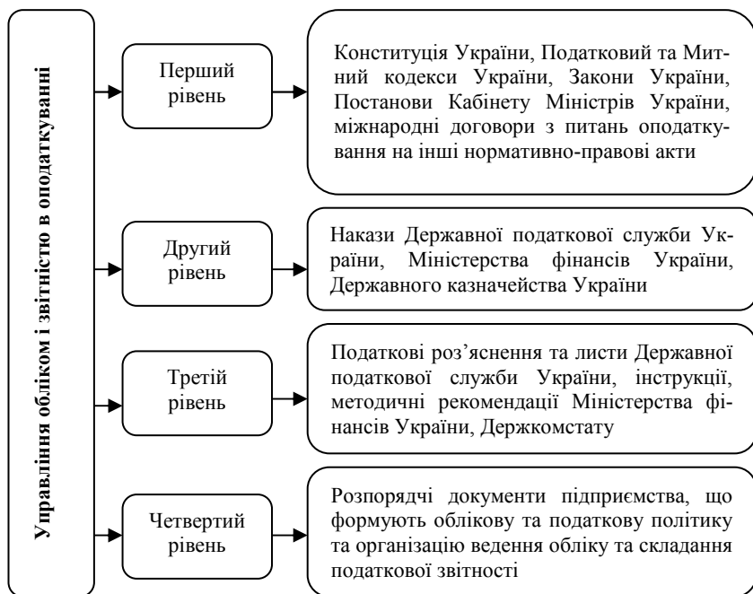
Рис. 1.3. Загальна схема управління обліком і звітністю в оподаткуванні в Україні

Схему структури нормативно-правового регулювання обліку і звітності в оподаткуванні підприємства наведено на рис. 1.3. Кожним рівнем управління обліком і звітністю створюється певна нормативна та методична база стосовно його ведення, цілей і завдань.