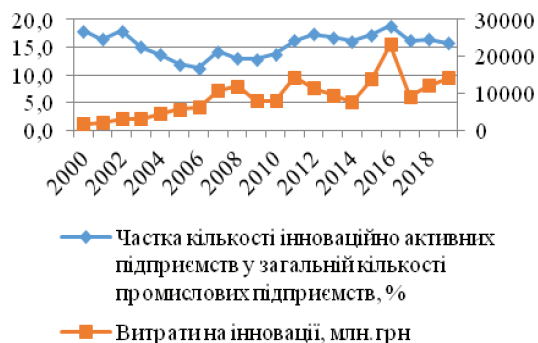
Рис.2 – Витрати на інновації промислових підприємств України за 2000-2019 р.р. (побудовано авторами за даними [7])

14112 млн. грн. або на 60,75%. У 2019 році обсяг витрат на інновації зростає по відношенню до 2017 року на 5103,4 млн. грн. або на 55,97%, але є нижчим за рівень 2016 року на 9008,6 млн. грн. або на 38,78%.