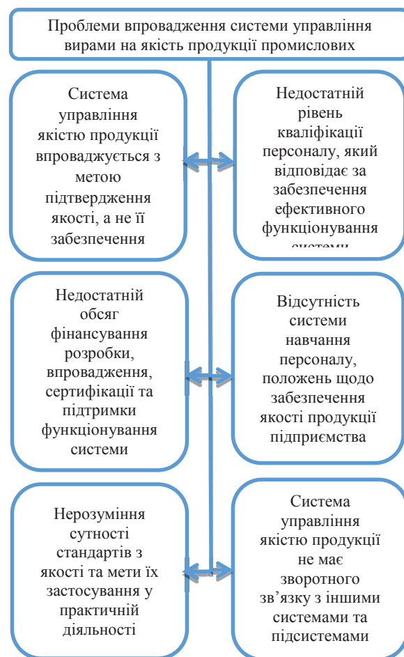
Рис.3 – Проблеми впровадження системи управління витратами на якість продукції промислових підприємств (складено автором на основі [8])

ефективності системи управління витратами на якість продукції, яка в свою чергу, повинна мати зворотні зв'язки з іншими системами та підсистемами підприємства.