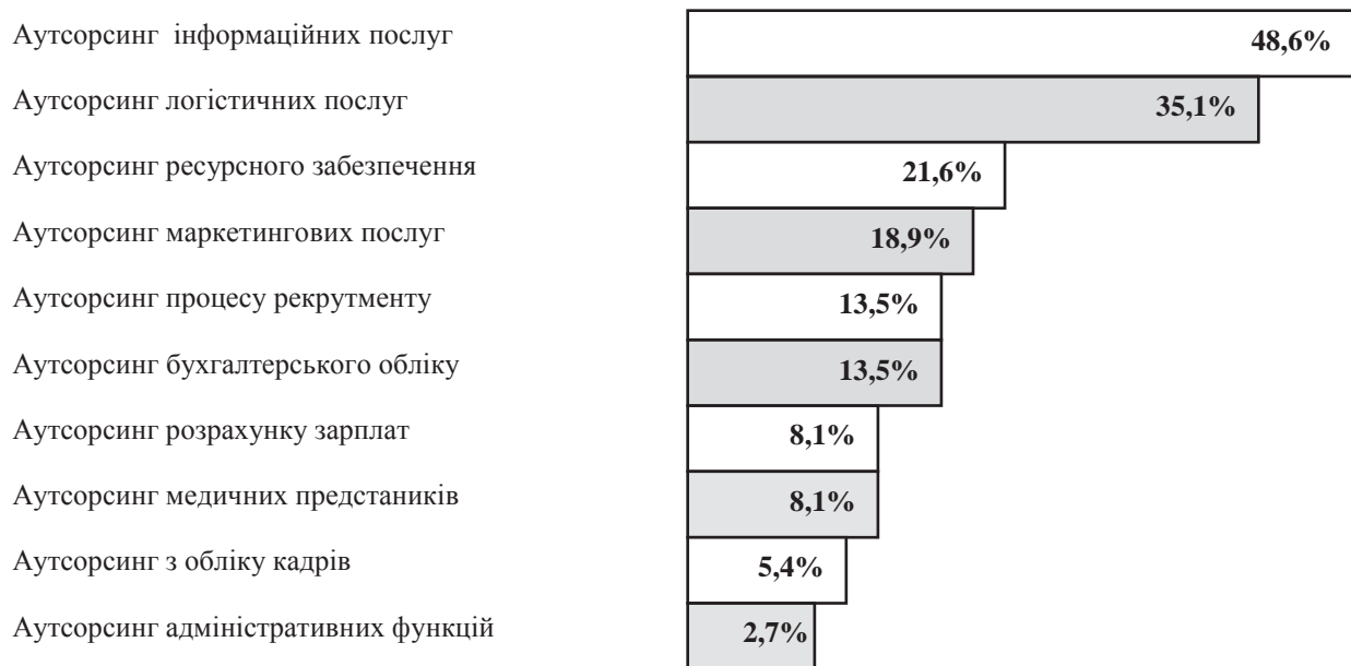
Рисунок 1 - Рейтинг потреб в послугах різних видів аутсорсингу в Україні