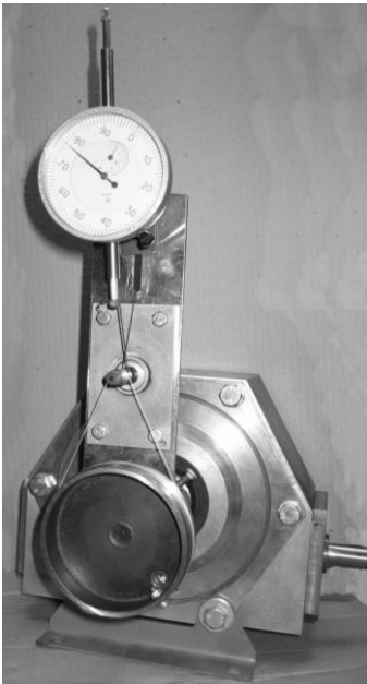
Рисунок 2 – Спіроїдний редуктор, налагоджений для перевірки закону руху механізму

На черв'як 3 установлений ділильний диск 1, кутове положення якого фіксується фіксатором 2. На вал колеса 4 установлено різьбовий ролик 5, який зв'язаний тросиковою передачею 6 з різьбовим роликом 7. З роликом 7 зв'язаний тросиком 8 шток індикатора 9. При повороті черв'яка на деякий кут \varphi_1 колесо повернеться на кут \varphi_2 і поверне на кут \varphi_3 ролик 7. При цьому повороті на ролик 7 намотується частина тросику 8, який перемістить шток індикатора 9 на величину l . Величина переміщення штока l , зафіксована індикатором, дорівнює коловому переміщенню точки шківів 5, знаючи яке можна визначити кут повороту спіроїдного колеса і миттєве передатне відношення. Якщо величина l мала, то на вісь ролика 7 встановлюється диск більшого діаметра і тросик 8 зв'язується з ним. Це дозволить підвищити точність вимірювання. На рисунку 2 показаний підготовлений до експерименту редуктор з встановленим пристроєм для визначення закону руху зачеплення.