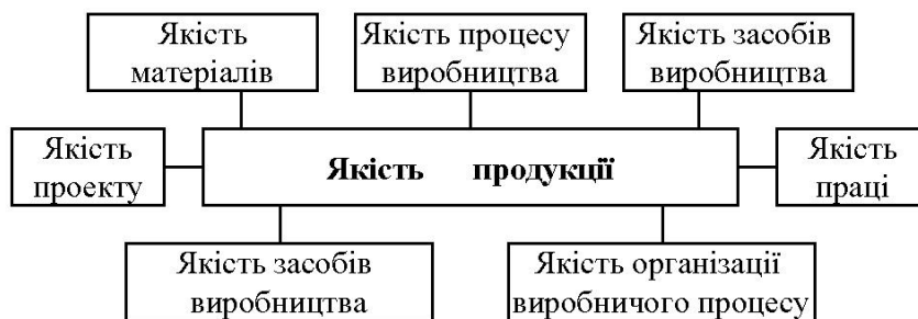
Рис. 2 – Фактори, що впливають на якість кінцевої продукції

Чинники, що впливають на формування якості, є основою систематичного вдосконалення системи організації виробництва, яка органічно поєднує в собі підсистеми забезпечення та контролю якості продукції, що випускається. Для забезпечення якості продукції необхідно керуватися перевіреним практикою багатьох підприємств основним принципом: робити якісно – завжди вигідніше. Відомий у світі фахівець з питань якості Каору Ісікава підкреслює: «Не слід економити на якості, оскільки якість сама є економією».