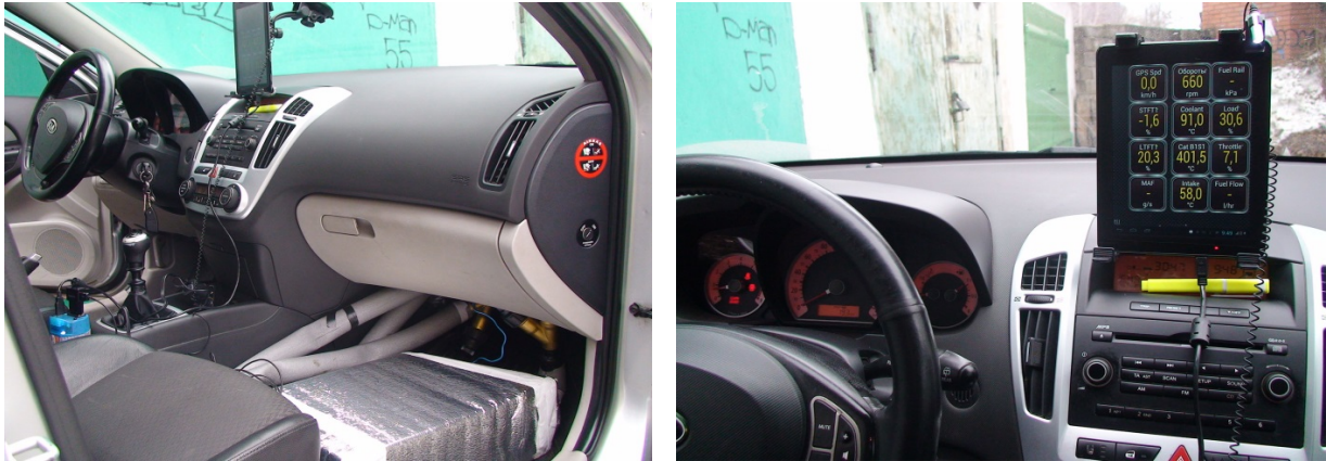
Рисунок 2 – Загальний вигляд вимірювального комплексу для дослідження роботи двигуна ТЗ з СП і ТА в процесі пуску і прогріву