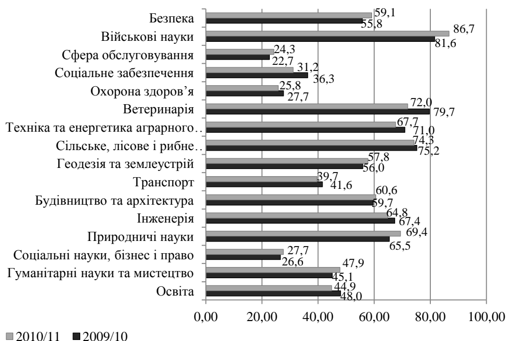
Рис. 2- Структура прийому студентів на навчання до ВНЗ III-IV рівнів акредитації за рахунок коштів державного та місцевих бюджетів, у % до загальних обсягів прийому за галузями знань

III-IV рівнів акредитації у 2010/11 н.р. (у 2,2 рази порівняно з 2000/01 н.р.).