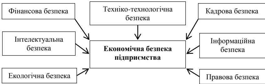
Рисунок – Функціональні складові економічної безпеки підприємства (узагальнено авторами на основі [1, 2]).

розширеного відтворення у довгостроковому періоді і у той же час є складовою частиною системи економічної безпеки на підприємстві. Формування інформаційно-аналітичного забезпечення економічної безпеки суб'єктів господарювання передбачає використання аналітичного інструментарію діагностики фінансового стану.