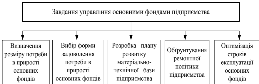
Рис. 1 - Завдання управління основними фондами підприємства

Метою і завданнями управління основними засобами підприємства є забезпечення максимально ефективного використання при мінімальних витратах на їх утримання та обслуговування (рис. 1).