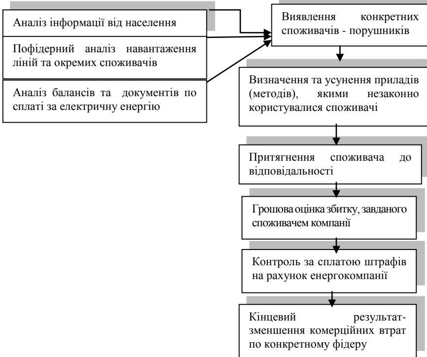
Рис. 2 - Схема виявлення точок безоблікового користування у споживачів

Однією з форм державної політики по відношенню якості електроенергії, ефективно діючою в умовах ринкової економіки, може бути тільки обов'язкова сертифікація електроенергії за показниками її якості. Введення обов'язкової сертифікації електроенергії означає необхідність для усіх рівнів підтвердити відповідність електроенергії, яку постачають споживачам, встановленим вимогам з використанням певних процедур [7].