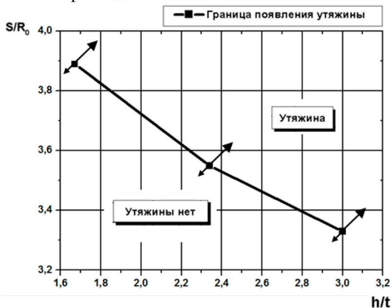
Рис. 3 Диаграмма зависимости появления утяжины от относительного хода деформирующего пуансона ( S/R_0 ) и относительной высоты фланца ( h/t )

Анализ характера изменения распределения интенсивности деформаций и интенсивности напряжений показывает, что значения данных показателей растут по ходу процесса, а наибольшие значения в очаге деформации сосредоточены в переходных зонах у кромок пуансона и матрицы. Максимальные значения деформации в этих зонах возрастают при уменьшении относительной высоты фланца.