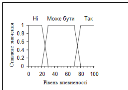
Рис. 1. Нечіткі значення для встановлення діагнозу

Досвід лікаря-експерта щодо набору розглянутих захворювань D зберігається в наборі нечітких таблиць, кожна з яких задає профіль для одного захворювання. Ми розглянемо три нечітких значення "Так", "Може бути" і "Ні", як показано на рис. 1, для виявлення наявності захворювання. Записи в таблицях профілю захворювання будуть формуватися з цих лінгвістичних змінних [9].