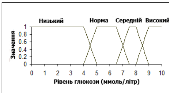
Рис. 3. Нечітка множина рівня цукру в крові

нечіткої змінної "середній" зі значенням коефіцієнту 0,3 і "Високий" зі значенням коефіцієнту 0.7.