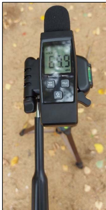
Рис. 2 – Вимірювання рівня шуму на об'єкті дослідження

Вимірювання рівня шуму проводилось за допомогою шумоміра, який було встановлено на штатив на висоті 1,3 м (рис. 2), швидкість вітру в період вимірювання становила не більше 3 м/с, що відповідає рекомендаціям виміру цього параметру. Мікрофон під час проведення досліджень було направлено у бік джерела шумового забруднення.