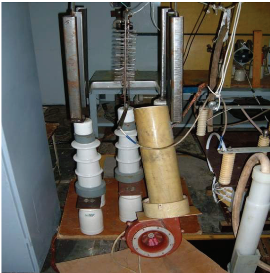
Рисунок 3 – Макет електродної системи з продувкою повітря на вістрях типу «щітка»

Були проведені дослідження впливу швидкості потоку повітря на запалювання і підтримку стабільного об'ємного розряду. Дослідження проведені на макеті електродної системи з продувкою повітря на вістрях типу «щітка» (рис. 3). Швидкість потоку повітря регулювалася в діапазоні від 0 до 20 м/с.