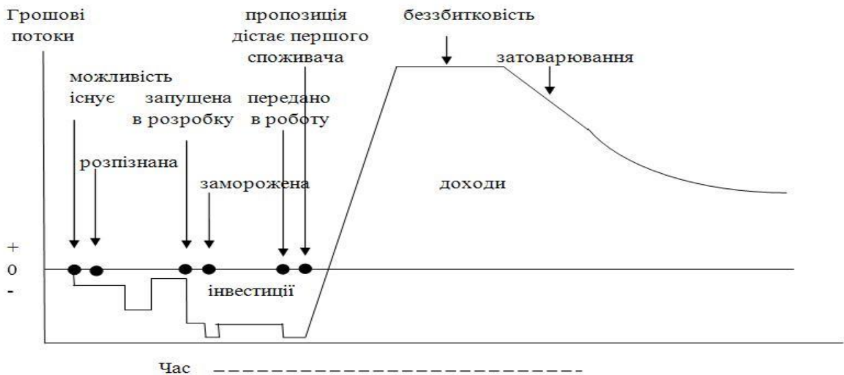
Рисунок 2 – Вплив стрімких інновацій на інноваційний процес

Аналізуючи рисунки бачимо, що завдяки впровадженню стрімких інновацій значно скорочено час розробки товару, зменшено інвестиції в розробку, та збільшено рівень прибутку завдяки виходу на ринок із високо диференційованим інноваційним продуктом раніше конкурентів. Впровадження таких інновацій стає