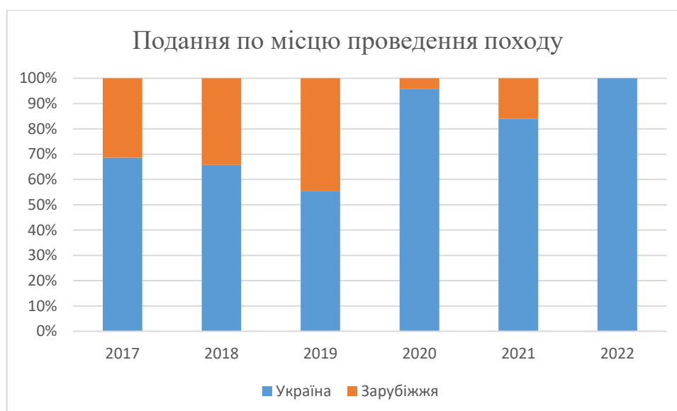
Рисунок 5 - Якісна картина відношення кількості походів, що проходили в Україні та за кордоном, та приймали участь у Чемпіонаті України

Що стосується доступності регіонів України для проведення спортивних походів через агресію рф. З 2014 р. було окуповано та стало недоступним для проведення спортивних походів приблизно 7% території України. В тому числі АР Крим, в якій до того проводилась велика кількість походів 3-5 к.с. У 2022 році території, що були окупованими, складала до 25%. Відсоток території, що відносився до так званої «сірої зони» та був суцільно непридатним для проведення походів навіть 1 к.с. на поточний момент оцінити досить складно.