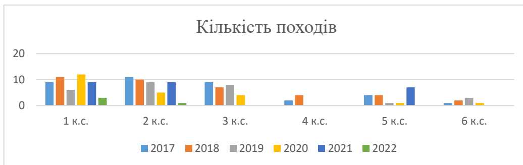
Рисунок 1 - Кількість походів на Чемпіонаті України згідно до року проведення та складності походу.

Наведена статистика не відображає повної картини: відсутні інші види походів; відсутні походи (в тому числі велопоходи), що зареєстровані в локальних осередках ФСТУ, але не були подані, чи не пройшли до фіналу Чемпіонату України. Так в часи до Covid19 кількість походів, що приймали участь в Чемпіонатах не в той же рік, коли відбувався похід а в наступних роках – не