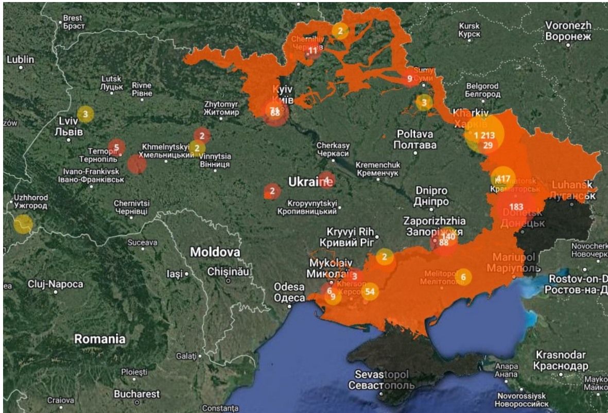
Рисунок 4 - Інтерактивна мапа мінної небезпеки за даними ДСНС [9]

мінною обстановкою можна ознайомитись на карті ДСНС (рис.4). При цьому ті ж ДСНС попереджають, що внаслідок агресії РФ – імовірність виявлення вибухонебезпечних предметів є високою для всієї території України, і залишається такою навіть в місцях які проходили перевірку і знешкодження [9].