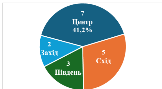
Рисунок 1 – Кількість тренерів зі стрибка з жердиною в Україні