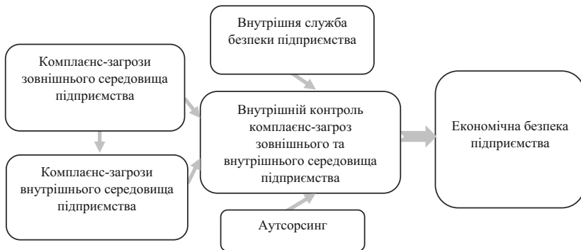
Рис. 6.19. Забезпечення економічної безпеки підприємства в умовах комплаєнс-ризиків (авторська розробка)

Серед переваг впровадження комплаєнс-контролю на промисловому підприємстві Перерва П.Г. виокремлює наступні [7, с. 155]: запобігання та мінімізація фінансових втрат, банкрутства і санкцій; налагодження системи виявлення і запобігання явищ шахрайства, корупції та іншого роду погроз бізнесу; збереження та розвиток ділової репутації підприємства; підвищення ефективності діяльності, підвищення конкурентоспроможності, інвестиційної привабливості і вартості підприємства.