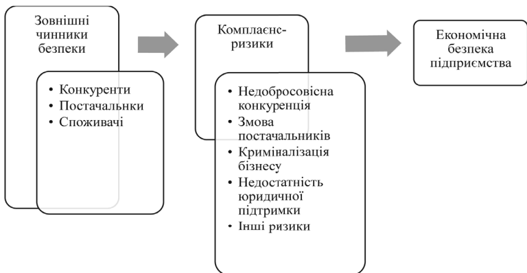
Рис. 6.17. Зовнішні чинники впливу на економічну безпеку підприємства (авторська розробка)

Часто негативний вплив на економічну безпеку підприємства є наслідком політики партнерів по бізнесу або конкурентів, що не має на меті заподіяння шкоди іншому підприємству. Первинним для будь-якого суб'єкта економіки є досягнення власних цілей. Більш серйозну загрозу економічній безпеці підприємства представляють свідомі дії зовнішніх структур, спрямовані на зниження іміджу контрагента, зниження економічних показників його діяльності аж до витіснення з ринку або рейдерського захоплення бізнесу. На рис. 6.18 представлені основні фактори, що сприяють криміналізації бізнесу.